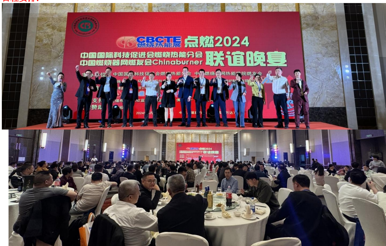
(点燃 2024 会员晚宴 晚会现场)

点燃 2025 中国燃烧器网@燃友会@燃烧热能分会 “锡”望您来 中国燃烧热能产业博览会会员联谊晚宴 日程安排: